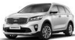
Snow White Pearl