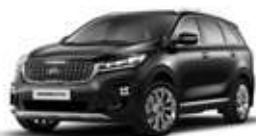
Aurora Black Pearl